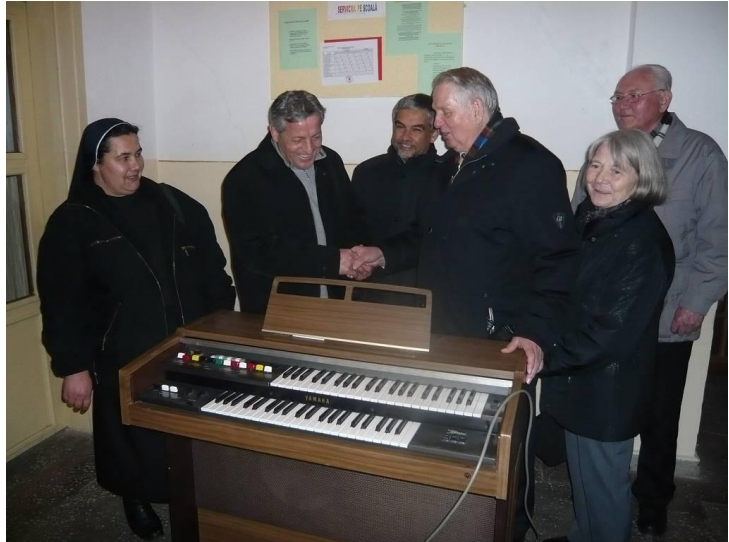
Die Kirchengemeinde freute sich über eine Orgel.